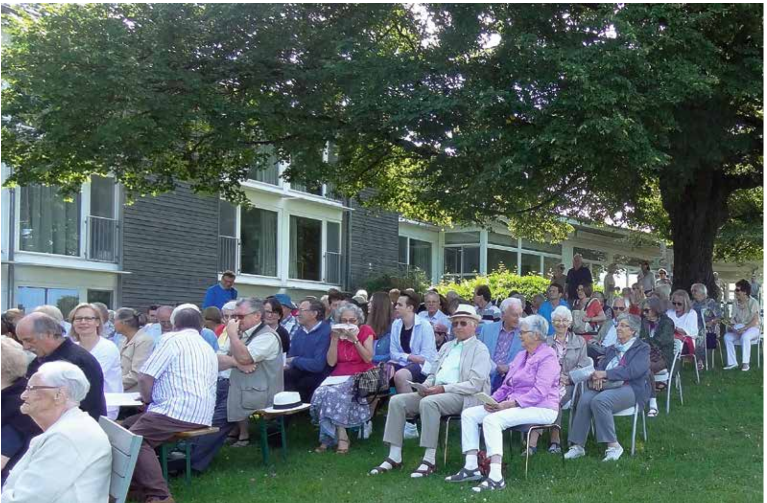
Am Bolderngottesdienst sah man auch fröhliche Gesichter aus Oetwil am See